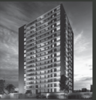
Edificio Urban UP