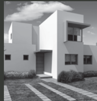
Condominio Jardín Oriente