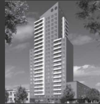
Edificio Centro Moneda