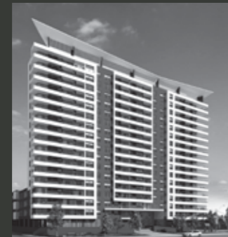
Edificio Mirador Parque los Reyes