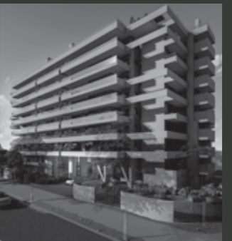
Edificio ARQ DOMUS