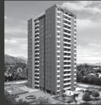
Edificio Centro Macul