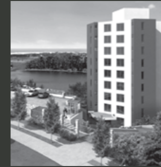
Edificio Puerto Andalú