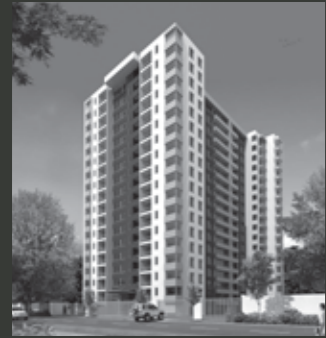
Edificio Armando Mook