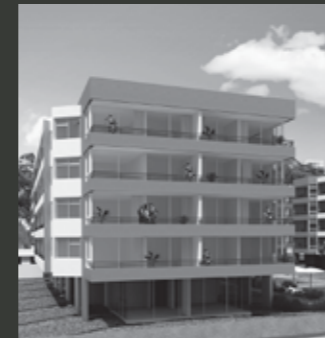
Edificio Bordemar Los Molles