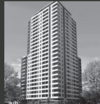
Edificio San Isidro