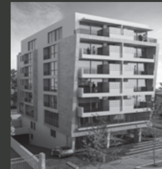
Edificio ARQ RODÓ