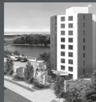
Edificio Puerto Andalú