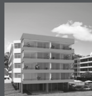
Edificio Bordemar Los Molles