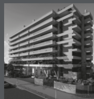
Edificio ARQ DOMUS