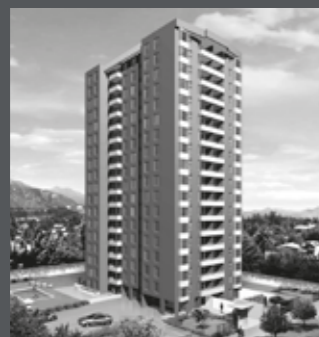
Edificio Centro Macul