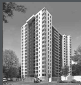
Edificio Armando Moock