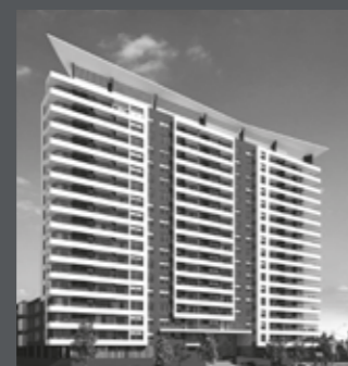
Edificio Mirador Parque los Reyes