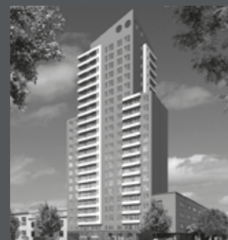
Edificio Centro Moneda