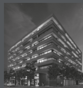
Edificio Punto ARQ