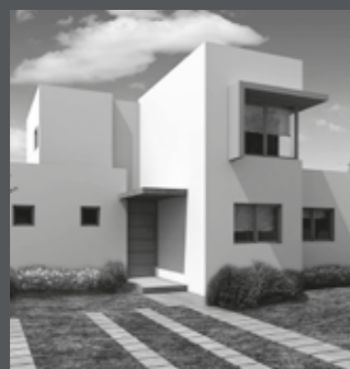
Condominio Jardín Oriente