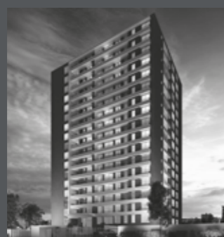
Edificio Urban UP