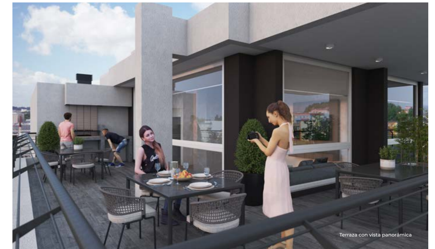
Terraza con vista panorámica