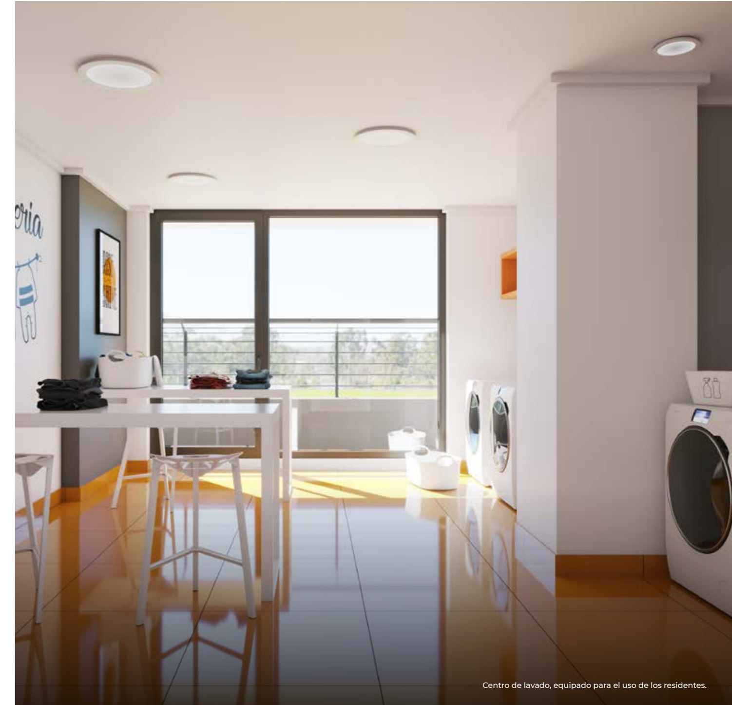
Centro de lavado, equipado para el uso de los residentes.

Con una moderna arquitectura y gran calidad, Atelier ha sido diseñado pensando en un estilo de vida urbano y contemporáneo, con múltiples espacios para compartir con amigos y familia.