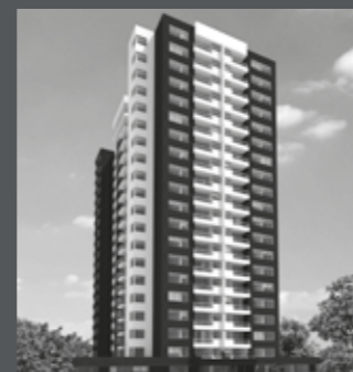
Edificio Cerro Amarillo