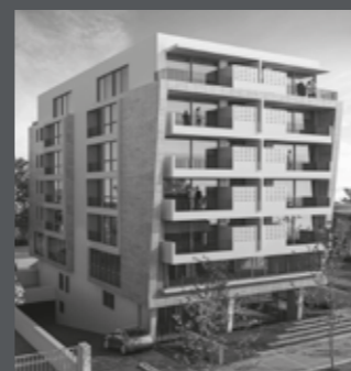
Edificio ARQ RODÓ