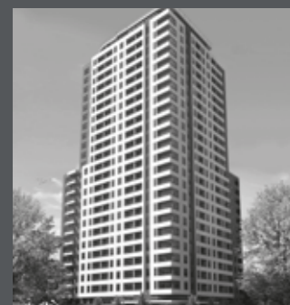
Edificio San Isidro