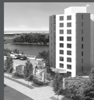
Edificio Puerto Andalú