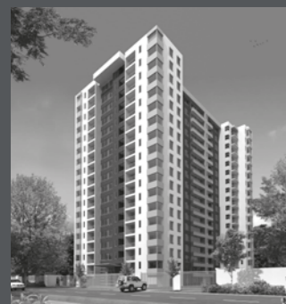
Edificio Armando Moock