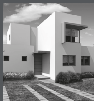
Condominio Jardín Oriente