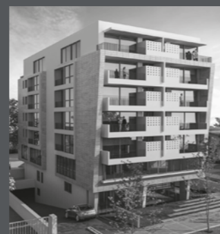
Edificio ARQ RODÓ