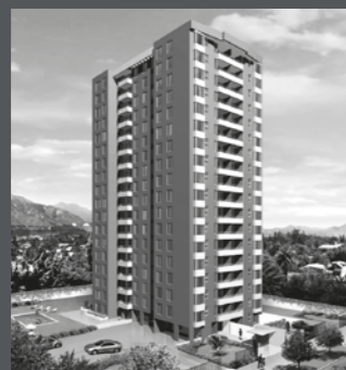
Edificio Centro Macul