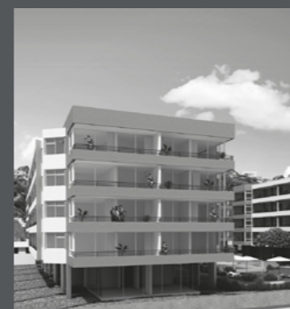
Edificio Bordemar Los Molles