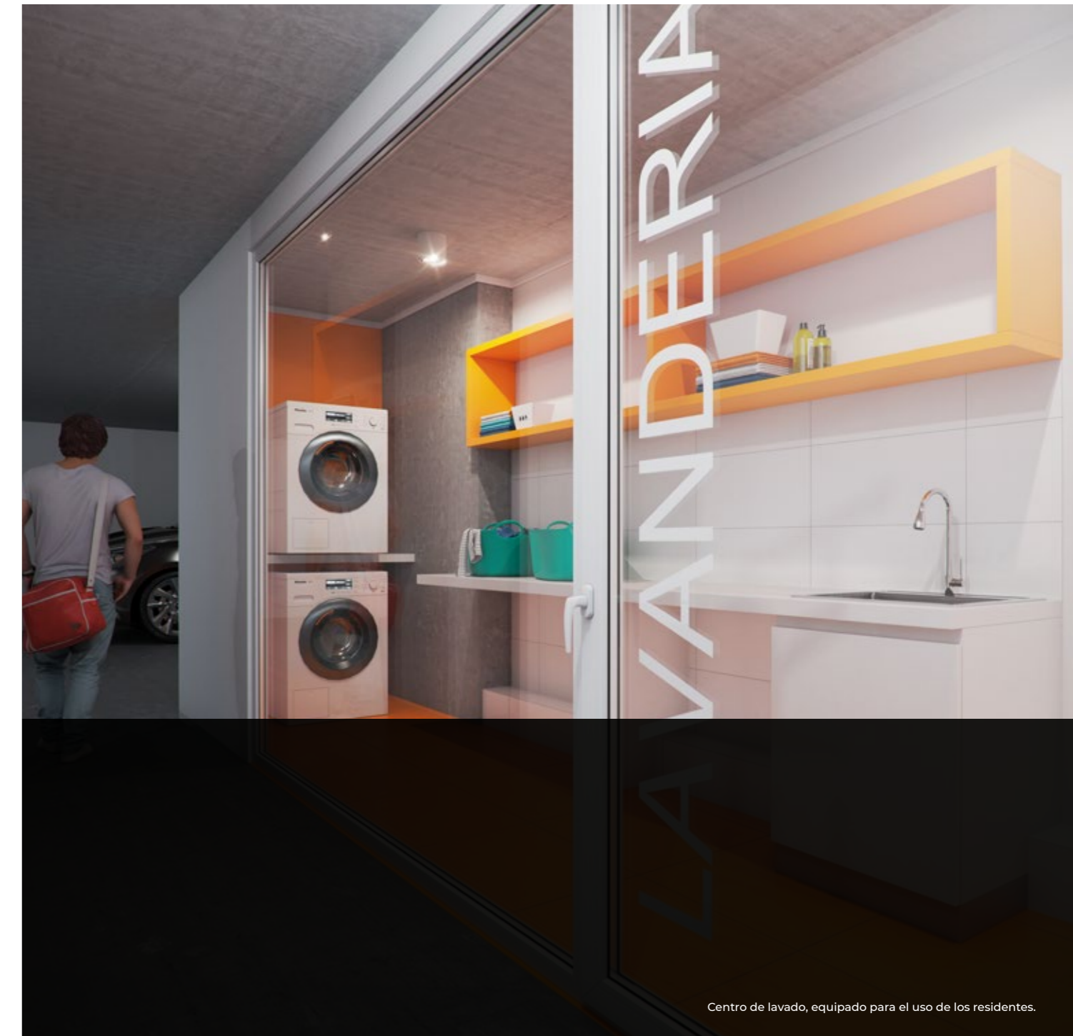
Centro de lavado, equipado para el uso de los residentes.

Con una moderna arquitectura y gran calidad, Atelier ha sido diseñado pensando en un estilo de vida urbano y contemporáneo, con múltiples espacios para compartir con amigos y familia.