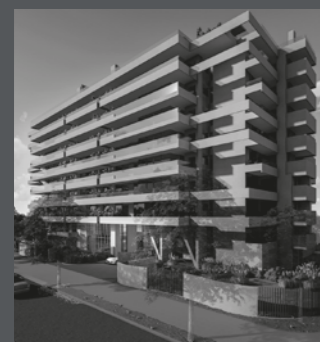
Edificio ARQ DOMUS